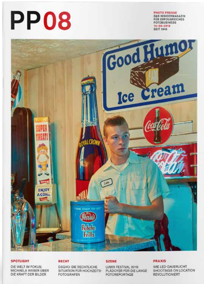
PHOTO PRESSE adressiert einmal im Monat die Foto-Professionals und New Professionals. Mit klarer Meinung, hohem Praxisgehalt und fokussierten Empfehlungen. PHOTO PRESSE berichtet über alle Themen rund um „Mit Fotografie Erfolg haben und Geld verdienen“.

Das Magazin erscheint bereits im 74. Jahrgang – und ist mit Gründungsjahr 1945 Deutschlands traditionsreichstes Fotomagazin. Die Leserinnen und Leser der PHOTO PRESSE setzen sich zusammen aus: Profifotografen (64 %), Fotohändlern mit Studio (16 %), Fotohochschulen und Ausbildungsstätten (9%), Behörden/Institute (6%) sowie Führungskräften und Entscheidern der Imaging-Branche (5%). Die Leserschaft deckt alle wesentlichen Bereiche und Genres ab: Hochzeits-, Porträt-, Fashion-, Sport-, Event-, Schul- und Kindergarten-Fotografie sowie Werbung, Food, Wissenschaft, Reise und Natur.